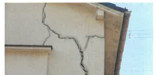
IPNS – Ne pas jeter sur la voie publique